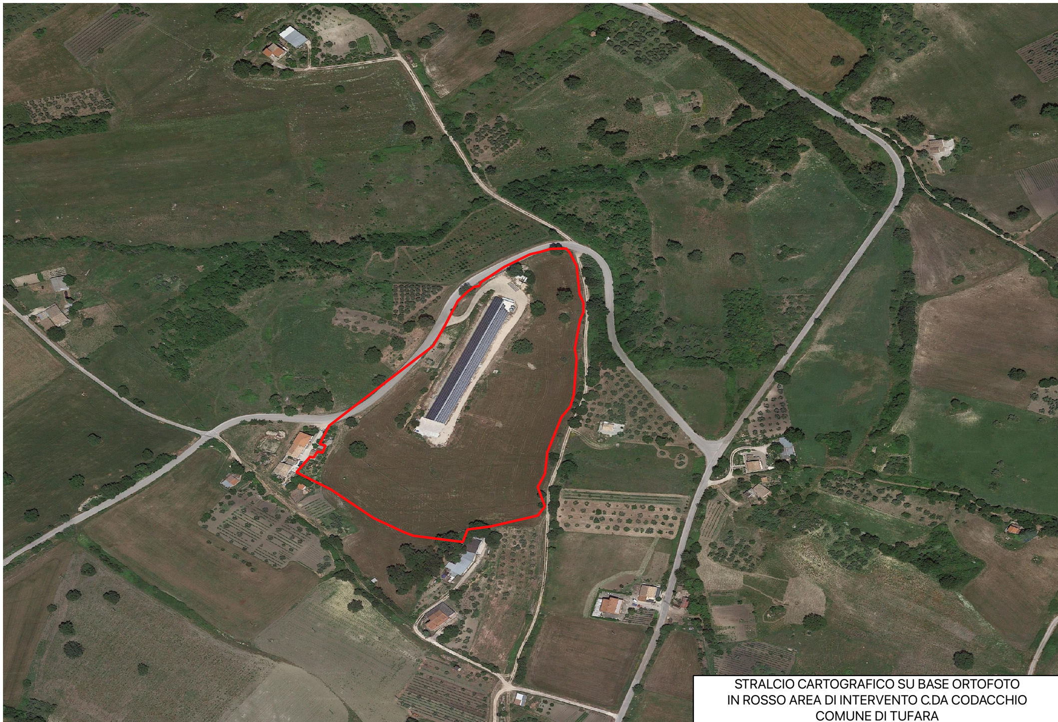
STRALCIO CARTOGRAFICO SU BASE ORTOFOTO IN ROSSO AREA DI INTERVENTO C.DA CODACCHIO COMUNE DI TUFARA